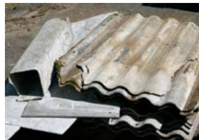
Asbestmaterial max 5 kg per år och hushåll får lämnas gratis i Kattarp. Materialet ska alltid vara förpackat.

Tryckimpregnerat och asbest räknas som farligt avfall. ÖGRAB har tillstånd från Länsstyrelsen för omlastning och lagring av det avfall vi samlar in från hushållen och våra återvinningscentraler. Tillståndet har vissa begränsningar som påverkar vilka mängder farligt avfall som får hanteras. För att inte bryta mot tillståndet har vi fastställt ovanstående regler.