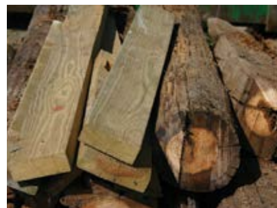
Tryckimpregnerat trä max 1 personbilssläp gratis.