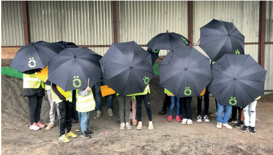
Elever från Prästavångsskolan på regnigt studiebesök i Kattarp

Vårterminen för SSA avslutades med studiebesök för Östra Göinge kommuns tredjeklassare. Tyvärr uteblev årets traditionella avslutsfest, SSA-dagen.