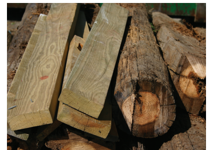
Tryckimpregnerat trä max 1 personbilsläp gratis.

Tryckimpregnerat och asbest räknas som farligt avfall. ÖGRAB har tillstånd från Länsstyrelsen för omlastning och lagring av det avfall vi samlar in från hushållen och våra återvinningscentraler. Tillståndet har vissa begränsningar som påverkar vilka mängder farligt avfall som får hanteras. För att inte bryta mot tillståndet har vi fastställt ovanstående regler.