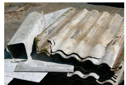
Asbestmaterial max 5 kg per år och hushåll får lämnas gratis i Kattarp. Materialet ska alltid vara förpackat.